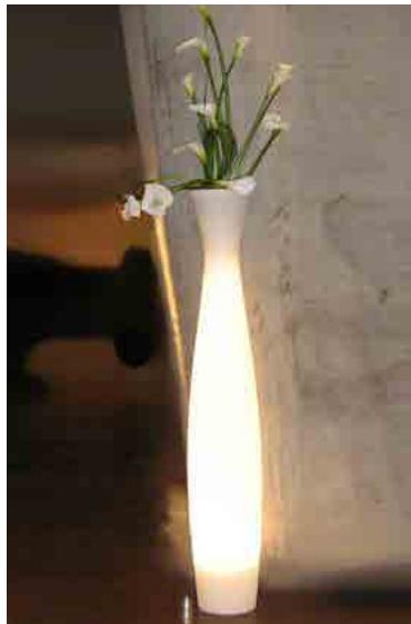
Réf. 134.259 A - Bac Scarlett light Ø 28 cm ht 1,80 m avec Arums blancs et feuillages