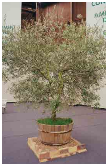
122.160 Olivier vieux tronc Ø 1,50 m - ht 2,50 à 3 m