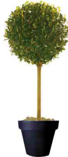
Réf. 112.160 - Laurier tige boule ht 1,80 m Ø 60 cm Réf. 134.359 - Vas three noir