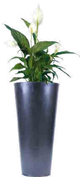
Réf. 113.300 A - Spatiphyllum sensation en bac Partner ht 1,80 à 2 m