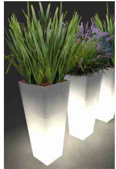
Réf. 134.327 A - Bac PVC Kubis ASQ light 46 x 46 cm ht 1,10m avec Phormiums