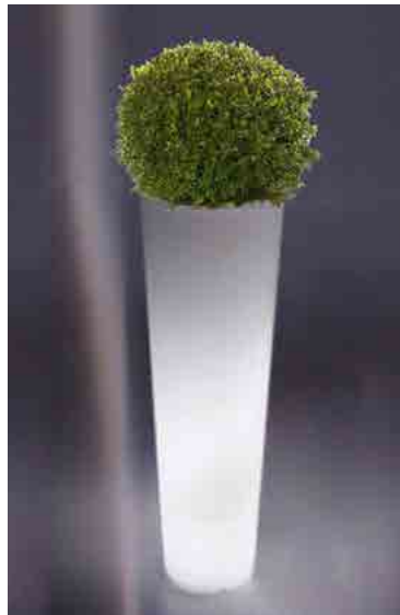
Réf. 134.326 A - Bac PVC New Pot Maxi light Ø44 cm ht 1,20m avec buis boule Ø45 cm