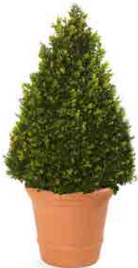
Réf. 111.140 - Buis cône Ø 50 cm ht 1 à 1,20 m