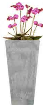
Réf. 113.410 C - Orchidées en bac Arstone ht totale 1 à 1,10 m