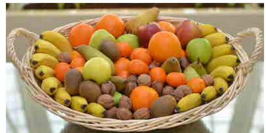
Réf. Pafruit 10K