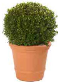
Réf. 111.125 - Buis boule Ø 35/40 cm ht 0,50 m