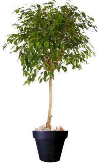
Réf. 123.220 - Ficus tige boule Ø 1,20/1,50 m - ht 2,50 à 3 m Réf. 134.359 - Vas three noir