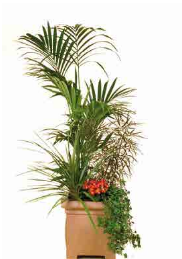
Réf. 141.100 à 144.400 Bac composé carré ou rond