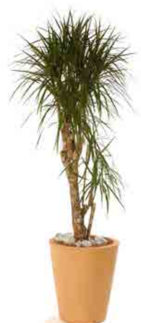
Réf. 113.130 - Dracaena maginata ht 1,80 à 2 m