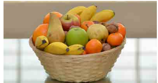
Réf. Pafruit 05K