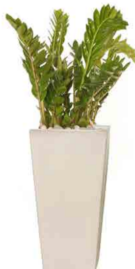
Réf. 113.410 B - Zamioculcas en bac Kubis blanc ht totale 1,30 m à 1,50 m