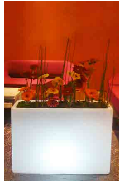
Réf. 134.315 A - Bac PVC rectangulaire light 92 x 22 cm ht 70 cm avec composition de Gerberas