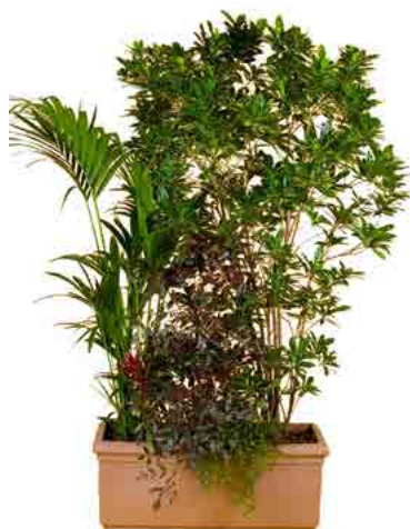
Réf. 143.200 - Bac composé rectangle 100 x 32 cm