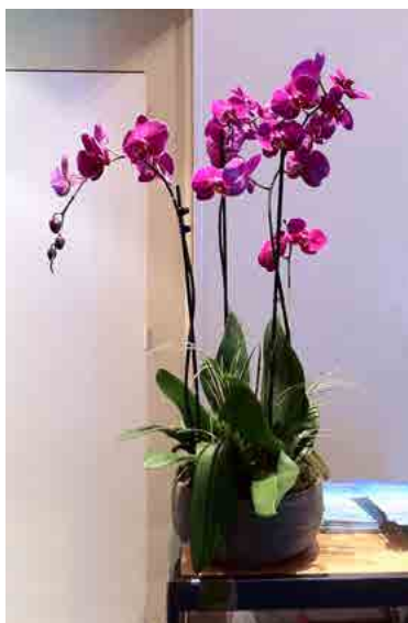
Réf. 182.200 - Coupe fleurie Ø 30 cm