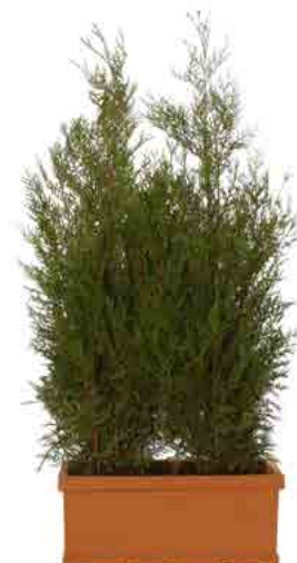
Réf. 142.900 - Haie de végétaux d'extérieur ht 1,50 m