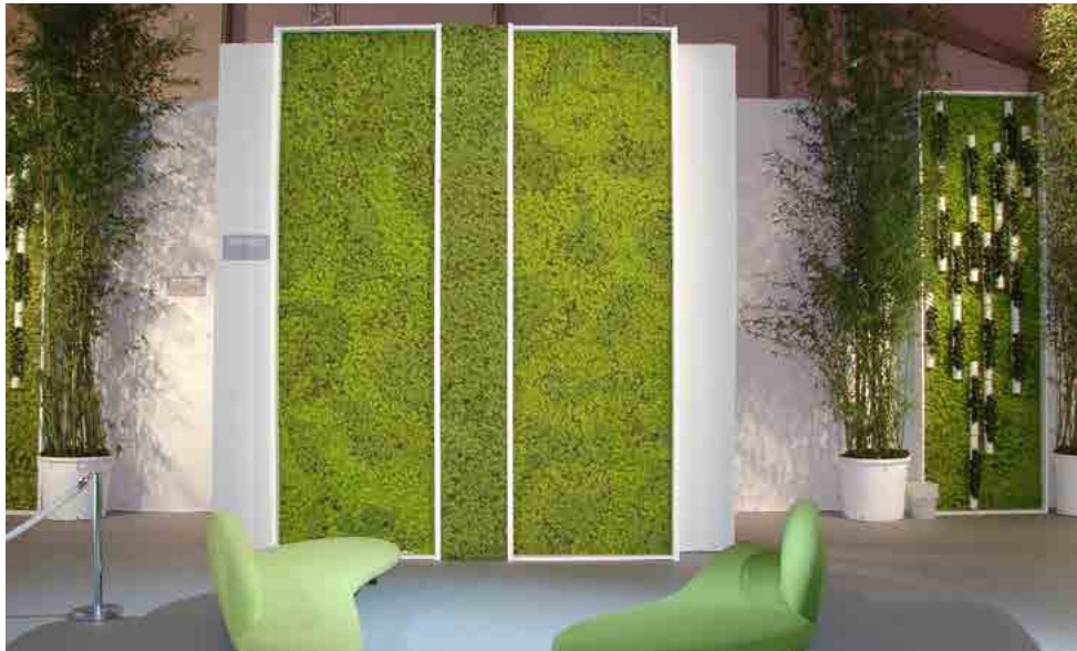
Tarifs sur devis