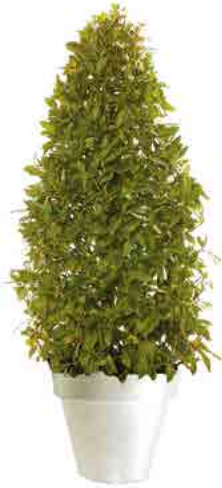
Réf. 112.135 - Laurier cône ht 1,50 m Ø 40/50 cm Réf. 134.363 - Vas three blanc

At Gally, we pride ourselves with the reputation of our presentations of both popular and exotic plant selections, presented in standard or tailor-made containers and designed to suit all tastes and decors. The objective is never to clash with or change the existing environment. Our specialists seek to create floral displays that blend with, and enhance, the beauty of the existing colour schemes and atmosphere.