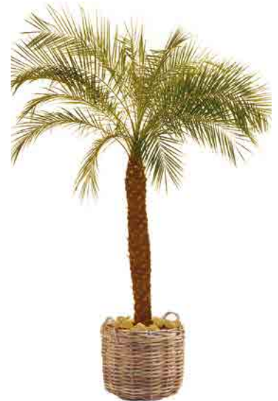
Réf. 113.230 - Phoenix roebelinii ht 1,80 - 2,10 m Réf. 136.300 - Vannerie osier