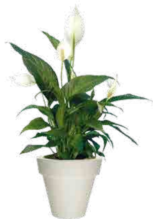
Réf. 113.310 Spatiphyllum Sensation ht 1,20 à 1,50 m Réf. 134.363 - Vas three blanc