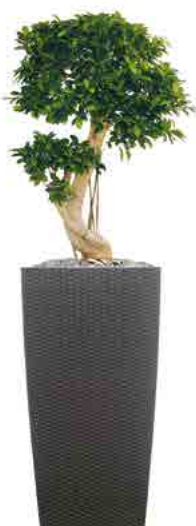
Réf. 113.410 A - Bonsai ficus nitida en bac Kubis cottage ht totale 1,20 m à 1,50 m

No floral selection or composition is beyond the capability or creativity of our master gardeners. We guarantee to find the right arrangements for you.