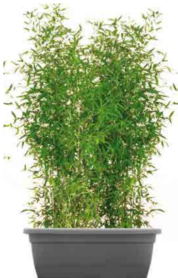
Réf. 142.960 - Haie de Bambous ht 2 à 2,50 m