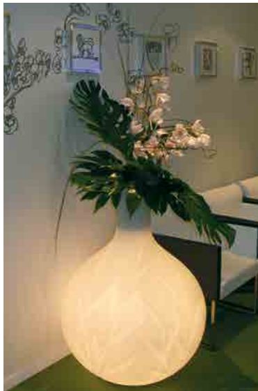
Réf. 134.300B - Bac Princess Light Ø 75 cm ht 1 m avec Orchidées et feuillages