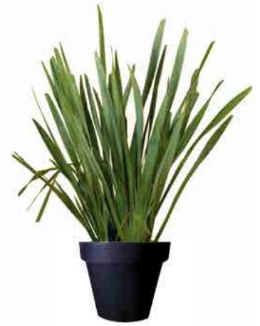
Réf. 112.300 - Phormium ht 1,20 à 1,50 m Réf. 134.359 - Vas three noir