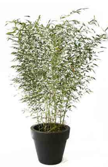
Réf. 111.110 - Bambou touffe ht 1,50 à 2 m Réf. 134.359 - Vas three noir