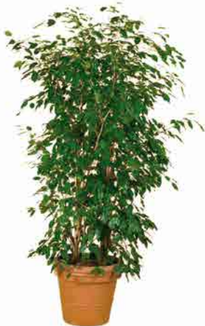
Réf. 113.160 - Ficus ht 1,80 m à 2 m