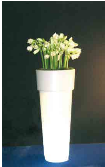
Réf. 134.320 A - Bac Marcantonio light Ø50 cm ht 1,20 m avec Arums blancs

The Gally Design Centre is staffed by knowledgeable and innovative experts who are ready to respond to every customer request. Whether a standard selection or a bespoke solution, our master gardeners guarantee an unsurpassed level of professional advice, project execution and customer satisfaction.