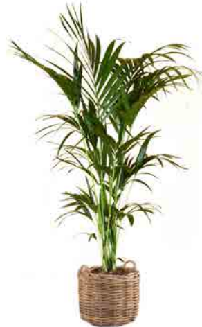
Réf. 113.200 - Kentia ht 1,80 à 2 m Réf. 136.300 - Vannerie osier